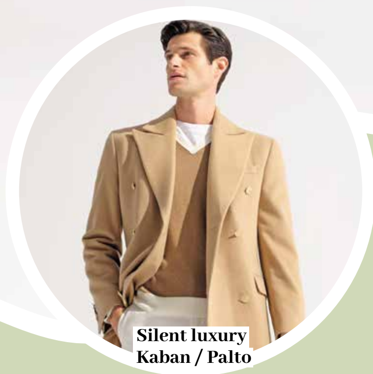
Silent luxury Kaban / Palto