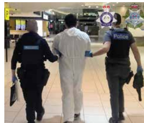
Tutuklananlar arasında 33 yaşındaki iki Çin vatandaşı, 34 yaşındaki Malezya vatandaşı ve 32 yaşındaki Hong Kong vatandaşı da yer alıyor.

Polis, bu kişilerin, 4 Ekim 2023'te Malezya'dan deniz kargosu yoluyla Melbourne'a gelen bir tuvalet kağıdı