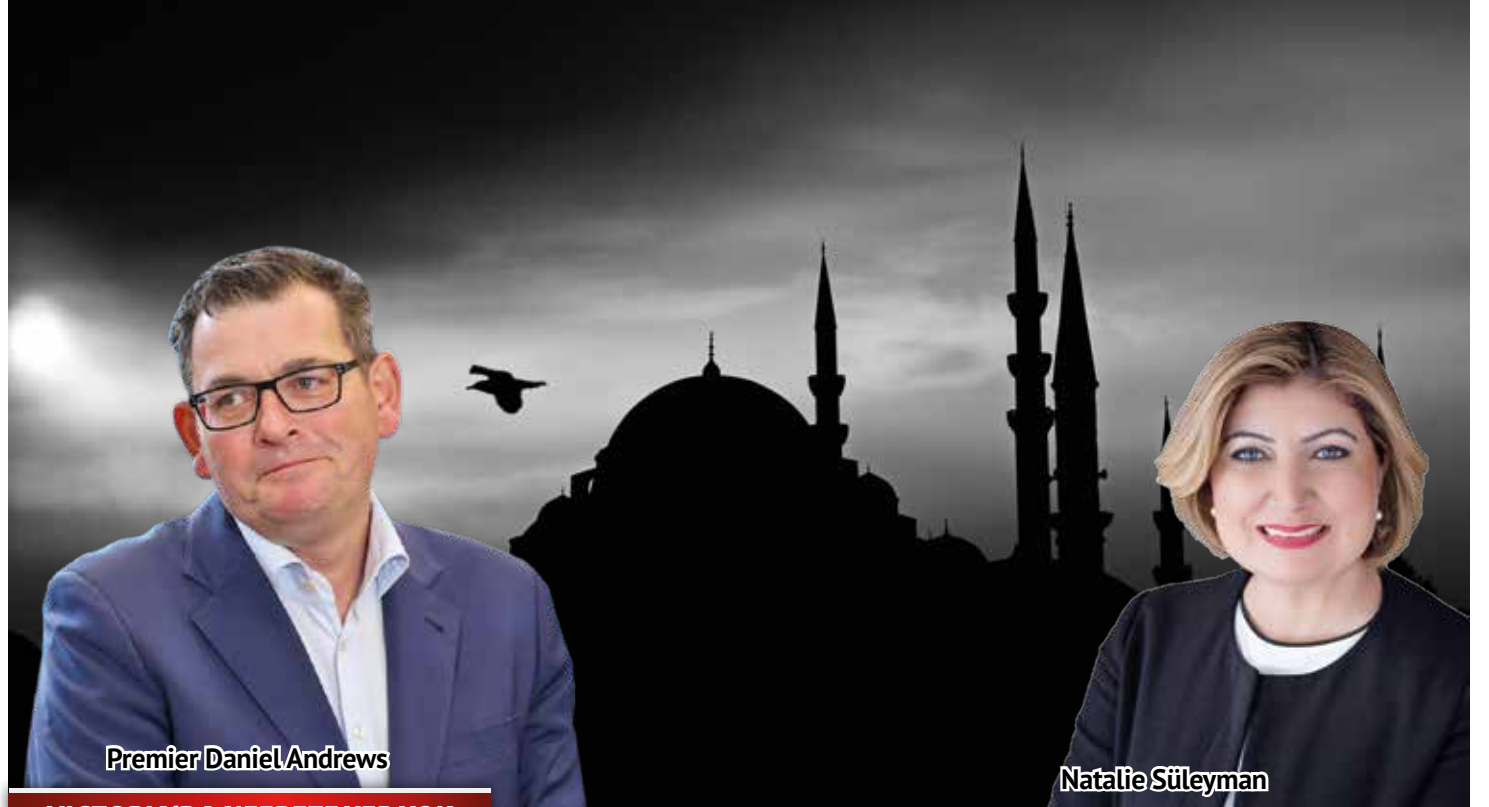
Premier Daniel Andrews