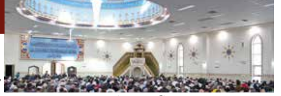
Victoria Premier Daniel Andrews, "Nereden olursanız olun, nasıl görüldüğünüz, neye inandığınız veya hangi dili konuştuğunuz önemli değil. Victoria'da nefrete yer yok."