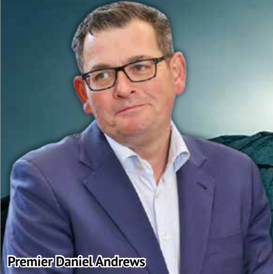
Premier Daniel Andrews